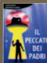
Fanatismo religioso e confronto-scontro fra culture e civiltà sono il vero messaggio sotteso a questo romanzo, costruito su una storia di spionaggio.

convinto non solo di possedere la verità, ma di essere investito di una missione sacra: far discendere in terra la Gerusalemme Celeste. Questa non è una novità nella storia del cristianesimo, perché in ogni epoca c'è sempre stato qualcuno che ha creduto di poter forzare la mano di Dio, con risultati di solito disastrosi. In questo nostro romanzo, le idee del Cavaliere sono talmente scombinare, infarcite di elementi apocalittici e pseudognostici, che diventano pericolose soltanto perché il Cavaliere ha così tanti soldi da trovare chi lo segue».